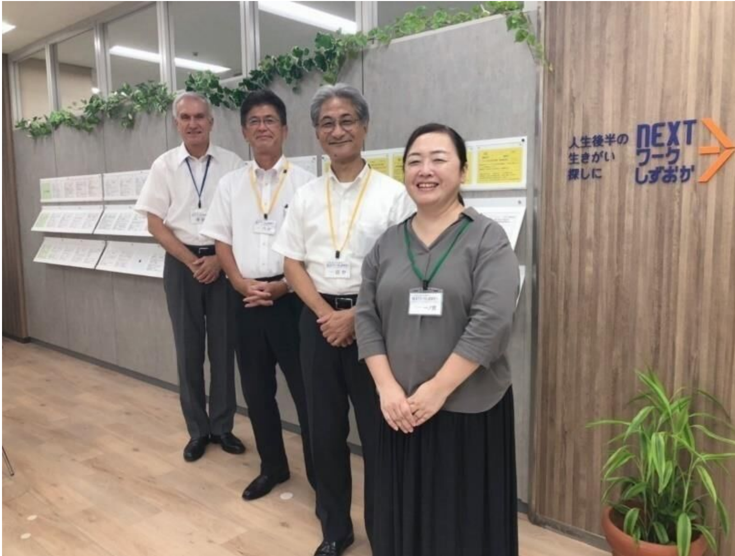
NEXTワークしずおか窓口