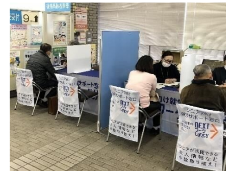
区役所出張相談会