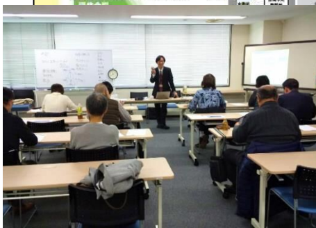
セカンド就労基礎研修 (R1~3) (再就職に向けたマインドセット研修)